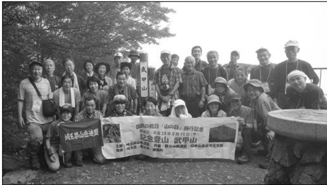
武甲山山頂で集合写真

秩父盆地の景観とさらに遠く両神や二子山の山並みを期待するが残念ながら曇りやガスで視界は無く、遠望することは叶わなかった。以前に見た景観を脳裏に浮かべ神社下の山頂広場で休憩とした。