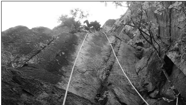
ウメコバ沢中央岩峰 凹角ダイレクトルート・4ピッチ目 写真・報告とも岡田 修

だから面白い！杯を交えればより一層楽しい。そんなことを再確認した SCM となりました。今年は 2 月の秩父に続き、2 回開催し、昨年いただいた「田中賞」を宴会費に充当させていただきました。この場を借りて厚く御礼申し上げます。また参加者の方々には、至らぬ設営にもかかわらず、笑顔でご協力いただき、感謝感謝です。大変楽しかったです、ありがとうございました。