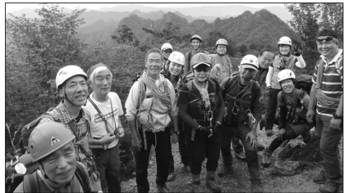
東岳山頂で参加者一同

あの山に行ったと言う記録でなく今後に繋げる為にも、もう少し内容を濃くした山行や講習が出来て行ければと思います。