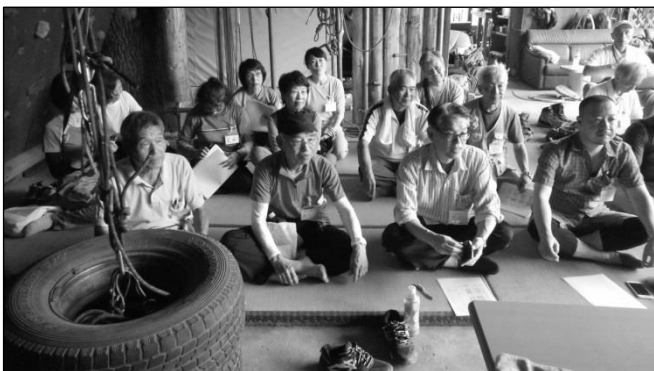
飯能日高消防署・大神田山岳救助隊長 の講義を聴く講習の皆さん

今後の山登りで自身・同行者が道迷いやアクシデントに遭わないことがベターですが、遭遇した際に、