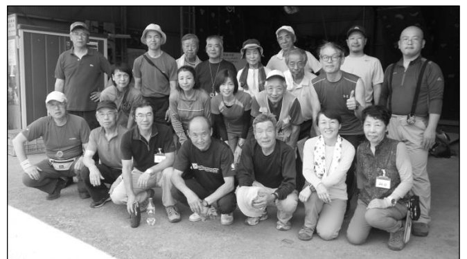
東吾野・アルパイン入門道場にて