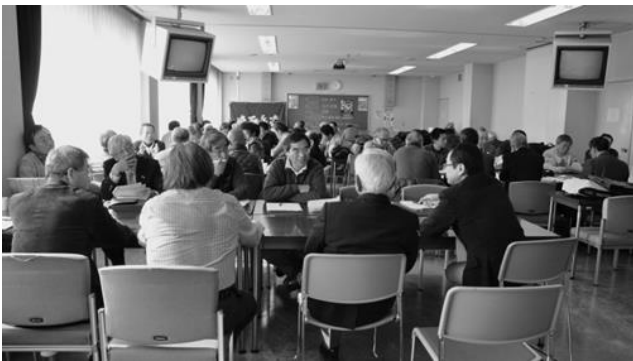
分科会会場 各委員会にて討議