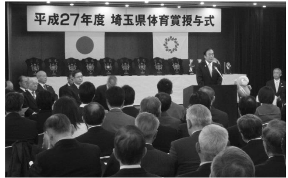
授与式挨拶 上田埼玉県知事

平成 28 年 3 月 12 日(土)、さいたま共済会館において埼玉県体育賞授与式が行なわれました。