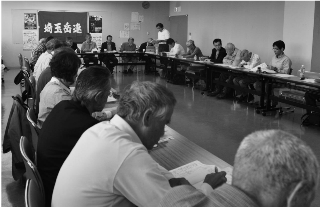
平成 28 年度 第 33 期 評議員総会 開催される